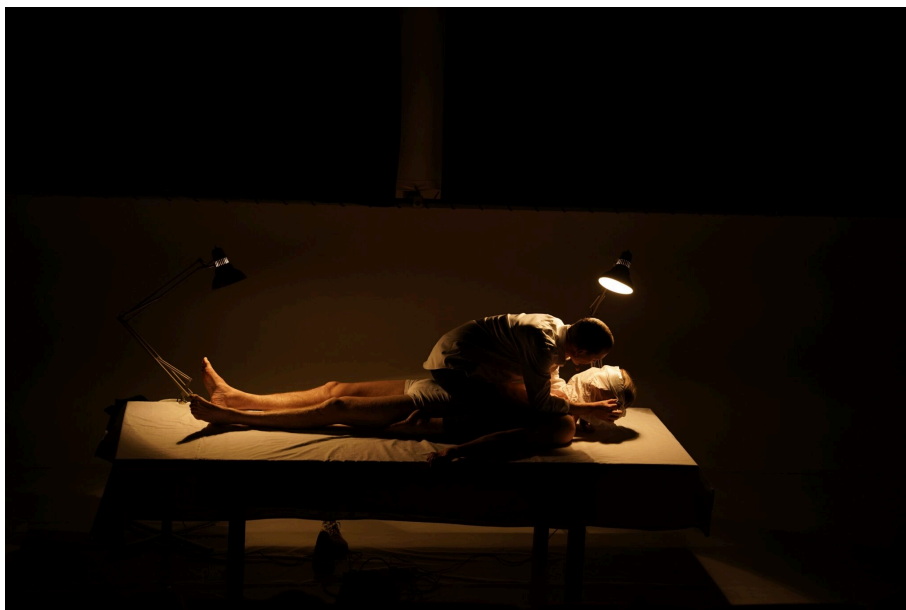
Our Other Body, Live Art for børn på Arken.

Når man scanner dem, ses en film med personens forklaringer om, hvordan de har myrdet psykiateren. Værket leger med begrebet identitet og selvpfattelse gennem et neurodiversitets blik. Måske kan én person godt være flere personer?