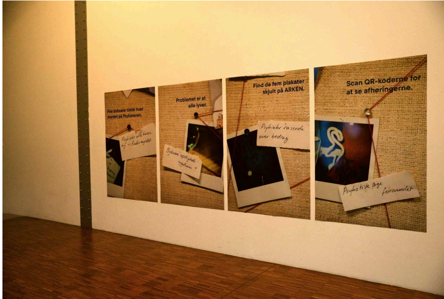
Illville, Live Art for børn på Arken.

Barkan lokaliserer det lille kiistrede organ, som suger racistiske oplevelser til sig og breder sig gennem tentakler til hele kroppen. Racismen får stor effekt på hans egen israelske familie. Frykten suges ind og deformerer krop, stemme og bevægeapparat hos generationer. Hvem eller hvad styrer, hvordan man agerer og bliver opfattet i samfundet? Stykket viser andre veje til identitetsskabelse.