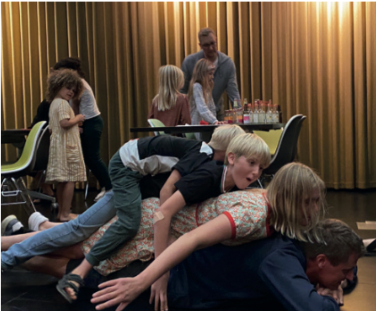
Tilskuerne opfordres til at deltage i løjerne, når Virak Revyens performancekunst udfolder sig.