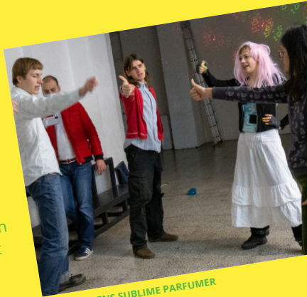
DANSESKOLENS SUBLIME PARFUMER

LØRDAG DEN 14. OKTOBER KL. 14.15 & 17.15 SØNDAG DEN 15. OKTOBER KL. 14.15 & 17.15