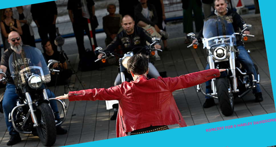
KONCERT FOR 9 HARLEY DAVIDSONS