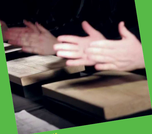
MUSIQUE DE TABLE

SØNDAG DEN 15. OKTOBER KL. 14.00 & 17.00