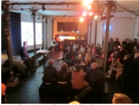
Artist Talk af Lone Twin (GBR).