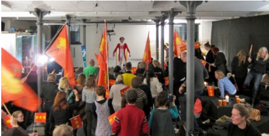
Den islandske performancekunstner Kristján Ingimarsson slår sjældent små brød op.

http://www.kunsten.nu/artikler/artikel.php?samtalekokkenet+3+liveart