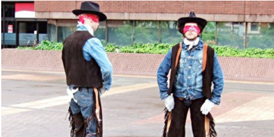
Britiske Lone Twin har i duo-form udfordret både sig selv og mennesker på gaden med deres skæve praksis. Her Ghost Dance .

http://www.kunsten.nu/artikler/artikel.php?samtalekokkenet+2+liveart+