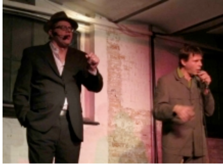
Finske Double Talk.

Det var der dog ikke enighed om, og dermed blev selve det performative værkbegreb sat til debat: Hvornår bliver kunsten performativ? Når vi deltager i den, eller når vi blot involveres intellektuelt i den.