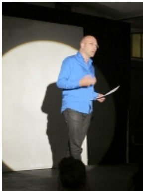
Torben Sangilds live-anmeldelse af CoreActs aktuelle værk: Undgåelsens bevægelighed .

"Jeg har været lidt inde på det, men performerne bevæger sig mellem at træde ind og ud af deres roller – og nogle gange ligger de et sted midt imellem at spille og at forholde sig til den helt konkrete situation. De er altså nogle gange i vores verden og nogle gange i deres egen verden, og nogle gange kommunikerer de så på tværs af de to verdener."