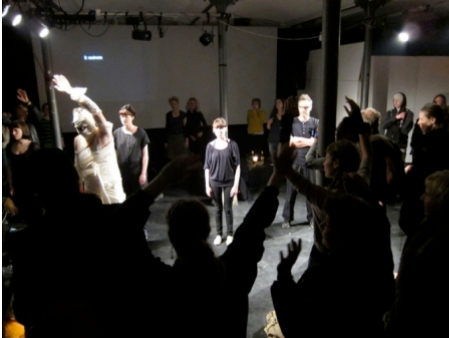
Er vi med eller imod?

mumies tilbagevenden som en støtte til demonstrationerne og folkets kamp for retfærdighed.