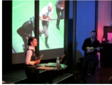
Artist Talk af Lone Twin (GBR) med musikalske indslag.

I Twenty Four Four kan man komme om natten og råbe sine inderste tanker ud over byen fra en høj stige, og gruppens seneste projekt The Boat Project er et gadekryds mellem en dagbog og en båd, hvor folks gamle træobjekter med en tilknyttet historie hugges op og samles i en bådkonstruktion – en anvendelig skulptur, som rent faktisk skal sejle.