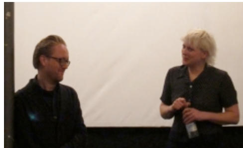
Der fnises en del efter Kjeldsmark og Jacobsens retur fra loftet.