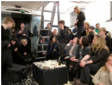
Popcorn?!