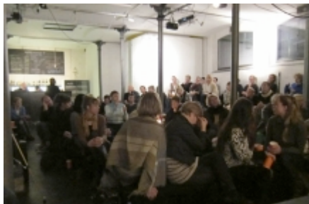
Der var godt pakket og god aktivitet blandt gæsterne i samtalekøkkenet.

"Her bliver der skabt en meget konkret metafor for den politiske debat i form af to farver bolde, der repræsenterer hver sin type debatør: 'problemforenkleren' (rød) og 'problemudgreneren' (pink). Vi bliver en del af et spil med nogle regler – det er sjovt, og det er en god, meget konkret metafor. Bagefter får vi alle sammen karakterer og en udtalelse, der lyder som om den kommer fra en