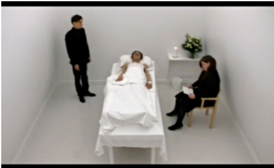
Das Beckwerk: Funus Imaginarium (fra live-transmissionen, 8. okt. 2010)

Aftenens live-anmeldelse og debat var som Helena Hei-Sook Park præget af kamp med de helt lavpraktiske forhold: